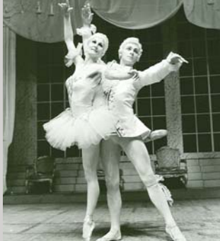
Pogled v glasbo – 100 let slovenskega baleta, stran 23