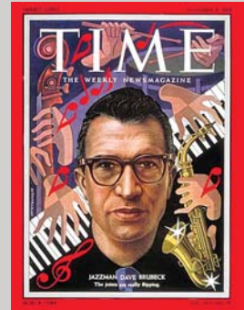
Vstaja jazza, 1. del, stran 40