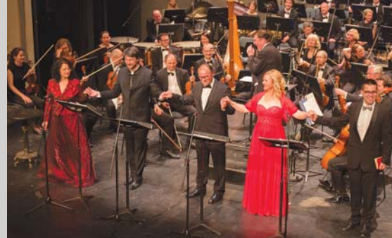
33. Slovenski glasbeni dnevi, stran 17