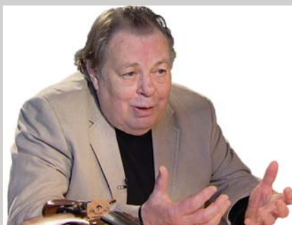
Dejanu Bravničarju v spomin, stran 15