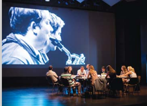
Glasbena tekmovanja, stran 10