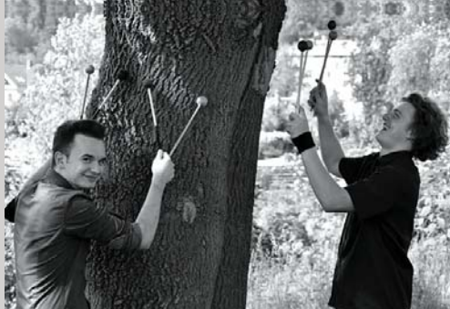
Duo Dendrocopos, stran 8